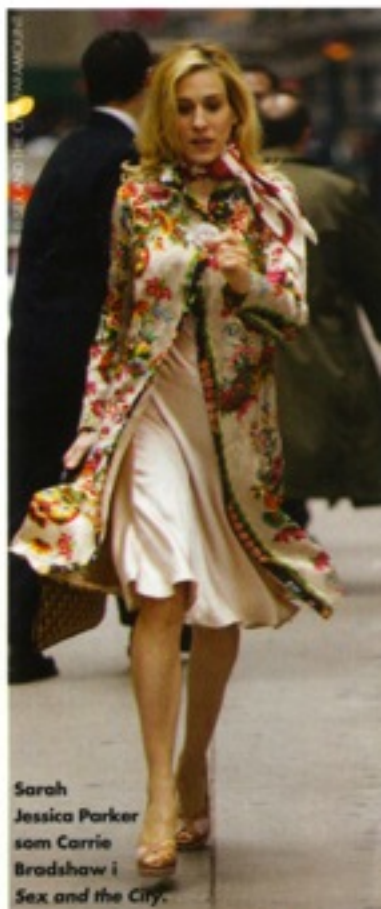
Sarah Jessica Parker som Carrie Bradshaw i Sex and the City .