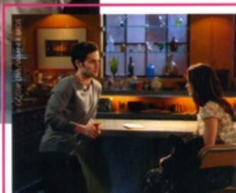
Hemma i Humphreys loft, ur Gossip Girl .