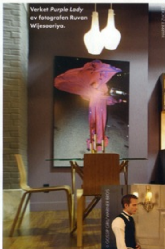
Verket Purple Lady av fotografen Ruvan Wijesooriya.